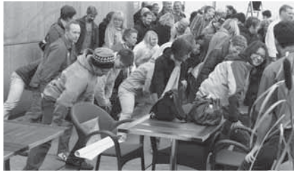
Bewegungspause auf der...

Nach so viel Kopfarbeit freuten sich alle Beteiligten auf die Kaffeepause. Nach er-