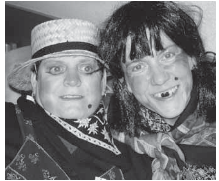
Strahlende Gesichter an der Fasnachtsfeier

Wir freuen uns auf die kommenden Jahreszeiten. Aber innerlich spüren wir schon jetzt die Vorfriede auf die nächste Fasnacht.