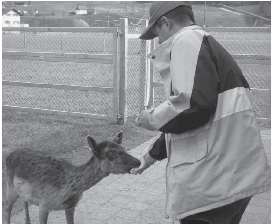
Die Damhirsche sind inzwischen zutraulich...