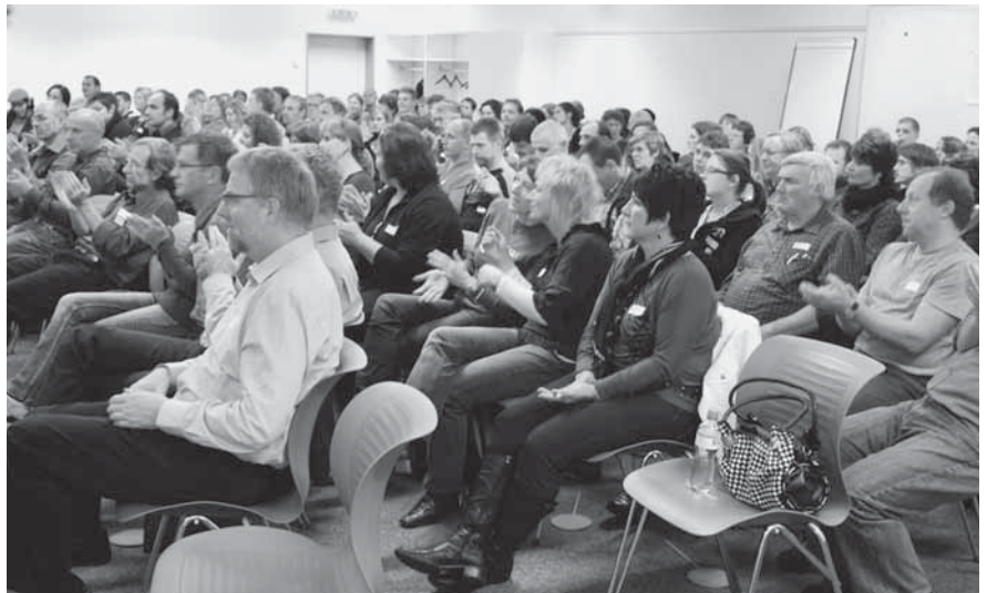
Applaus für den abwechslungsreichen und interessanten Tag

Wir freuen uns auf die nächste Vollversammlung im November 2010!