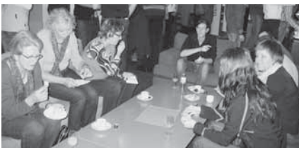
Stärkung bei der Kaffeepause

Die Teilnehmenden arbeiteten anschliessend in verschiedenen Gruppen, (Dauer: rund 30 Minuten), welche von Projektmitgliedern und Führungskräften moderiert wurden. In den Teams wurde angeregt über die Grundhaltung diskutiert.