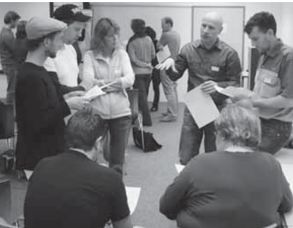
Agogische Grundhaltung – wie setzen wir diese um?

kleinen Sketch und einer kurzen Präsentation zeigte es mithilfe des sprichwörtlichen roten Fadens witzig und anschaulich zugleich, dass das vorliegende Resultat nicht einfach selbstverständlich ist. Vielmehr waren zahlreiche Gespräche mit verschiedensten Personen inner- und ausserhalb der BSZ Stiftung, viel Denk- und Diskussionsarbeit nötig, um das gelungene Ergebnis zu erreichen.