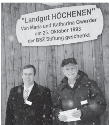
Medienanlass mit Regierungsrat Armin Hüppin und Peter Wahli

Zusammen mit Menschen im beruflichen Umfeld ein Unternehmen mitprägen zu dürfen, hat mich schon sehr früh in meinem beruflichen Leben äusserst fasziniert. Zu-