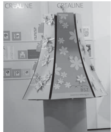
Unser Stand an der ORNARIS

Eine Messe ist immer wieder eine gute Gelegenheit, um zu spüren, was der Markt will. Anhand von Kundenreaktionen der letzten ORNARIS im August 2009 in Zürich haben wir festgestellt, dass die Nachfrage an fertigen Karten gross ist und den Kunden oftmals zu neuen Ideen verhalf. Zu Spezialanlässen wie Muttertag, Erstkom-