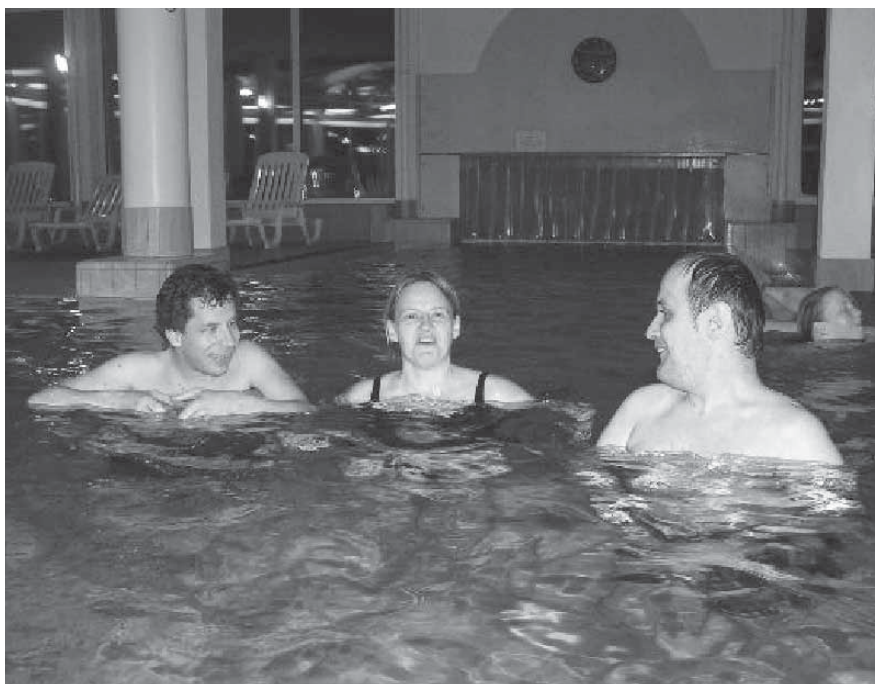
Entspannung im Wasser

Dank der ehrenamtlichen und finanziellen Unterstützung können wir das Schwimmen für unsere Menschen mit Beeinträchtigung zur «Normalität» werden lassen.