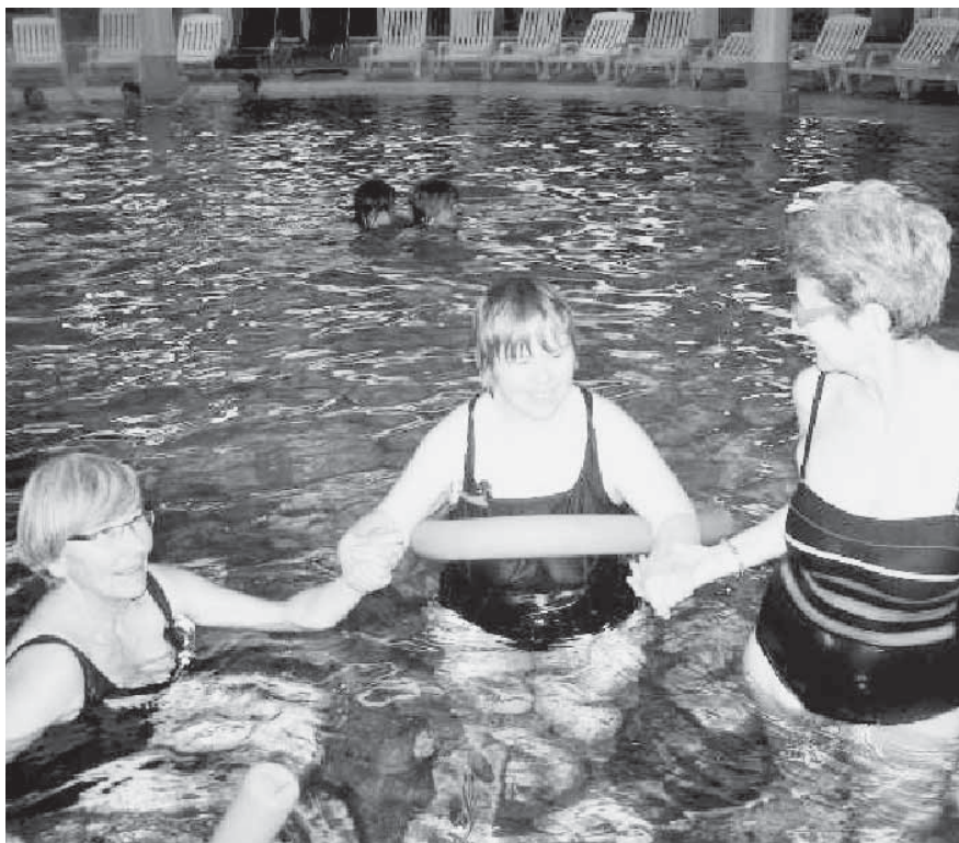
Eine Teilnehmerin mit zwei ehrenamtlichen Helferinnen

Die Kantonalbank Schwyz unterstützt dieses neue Angebot mit einem einmaligen Betrag von Fr 5000.– und hat damit die Realisierung für das Jahr 2010 erst ermöglicht.