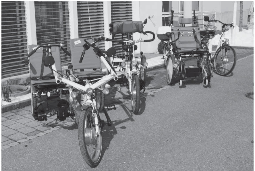
Verschiedene Modelle stehen zur Auswahl

Nähere Informationen zu dieser neuen Dienstleistung, zu den Hintergründen dieser Aktion und Angaben zu den Velos sind unter http://www.ekz.ch/internet/ekz/de/ueberuns/sponsoring/sozio-sponsoring/spezialvelos.html ersichtlich.