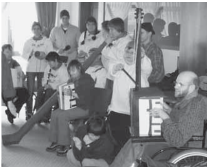
Die Ländlerkapelle «Geisshimmel» in Action

Unter dem Motto «Älplergaudi» haben unsere Vorbereitungen bereits anfangs Januar 2010 begonnen. Für den geheimen Überraschungsauftritt der Ländlerkapelle «Geisshimmel» haben wir einen grossen Kontrabass, drei Handorgeln, zwei Klarinetten und ein grosses Alphorn gekleiert und entsprechend mit Wasserfarben bemalt.