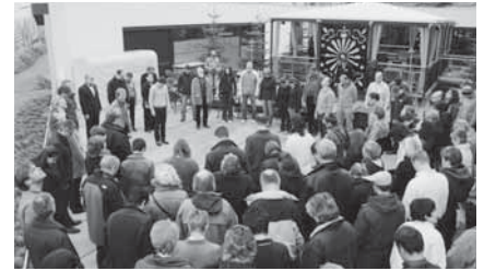
...Terrasse des Hotels Seedamm Plaza

Zum Abschluss waren noch einmal Kreativität und Flexibilität der Teilnehmenden gefragt: Sie mussten – in sechs Gruppen aufgeteilt – eine «Skulptur», eine Präsentat-