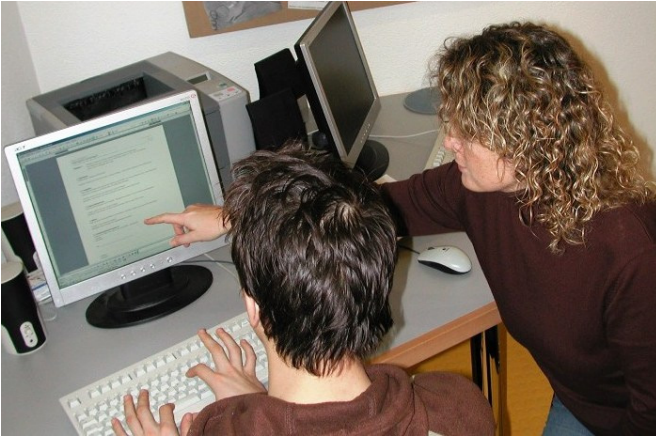
IV-Lernende in der BSZ-internen Ausbildung