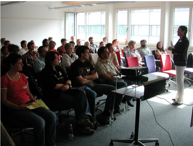
Für die Angestellten ist die interne Ausbildung obligatorisch.