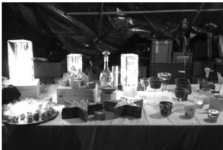
Mosaik-Lampen und Teelichter waren der Renner.

Der Weihnachtsmarkt vom 22. November 2008 in der wunderschönen Seestadt Altendorf war ein Erfolg. Zahlreiche Besucher liessen sich von der weihnächtlichen Stimmung, die der leichte Schneefall unterstrich, verzaubern. Nicht einmal der eisige Wind vermochte die gute Stimmung zu schmälern – gab es doch vom Glühwein bis zum Fondue am offenen Feuer genug Gelegenheit, sich aufzuwärmen. Auch am Stand der BSZ Lachen haben die Kunden Geschenke und Dekorationen eingekauft. Die Renner waren die Schwemmholz-Engel, Mosaik-Lampen und Mosaik-Teelichter. Wir sind mit dem Umsatz sehr zufrieden. Erste Ideen für den nächsten Markt entstehen bereits.