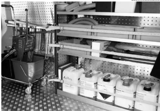
Das Auto ist ausgestattet mit allem, was es zur Liegenschaftspflege braucht.

Mit dem neuen Fahrzeug fahren wir zu den externen Kunden, um deren Liegenschaften zu pflegen. Die Kunden, können sich aufs Wesentliche konzentrieren und uns die Hauswartung, Reinigungs- und Umgebungsarbeiten im und um die Gebäude überlassen. Sie sparen nicht nur den «Bessen», sondern auch Personal, Löhne, Maschinen und Kontrollen.