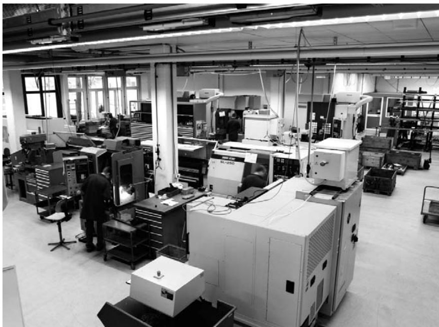
Metallbearbeitung Steinen: Auch hier arbeiten Mitarbeiter ALLORA.

Ich wurde im Team sehr gut aufgenommen. Die Angestellten sind engagiert und beantworten mir meine Fragen und Anlie-