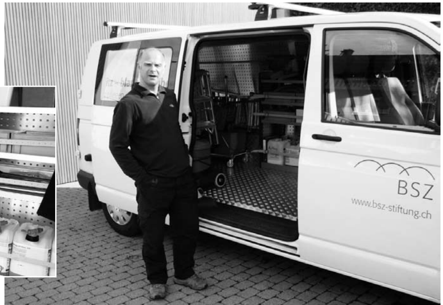
Fachpersonen sind mit dem Fahrzeug unterwegs zu den Kunden.

In diesem Sinne wünsche ich blitz – blank – sauber weiterhin gutes Gelingen und viel Erfolg.