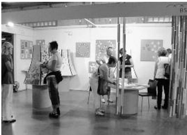
Der BSZ-Stand an der Ornaris in Zürich

Mit der Produktlinie FORMPAPIER bieten sich der BSZ Stiftung neue Möglichkeiten, geeignete Arbeiten für Menschen mit einer Beeinträchtigung anzubieten.