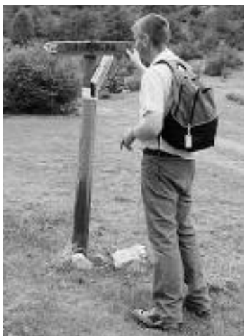
Ein agogisches Ziel – verschiedene Wege

Niemand wird der Landkarte die Schuld geben können, wenn die Wanderung wegen Nebel oder Schneefall abgebrochen werden muss. Dies ist auch im Betreuungsalltag so. Die reale Situation