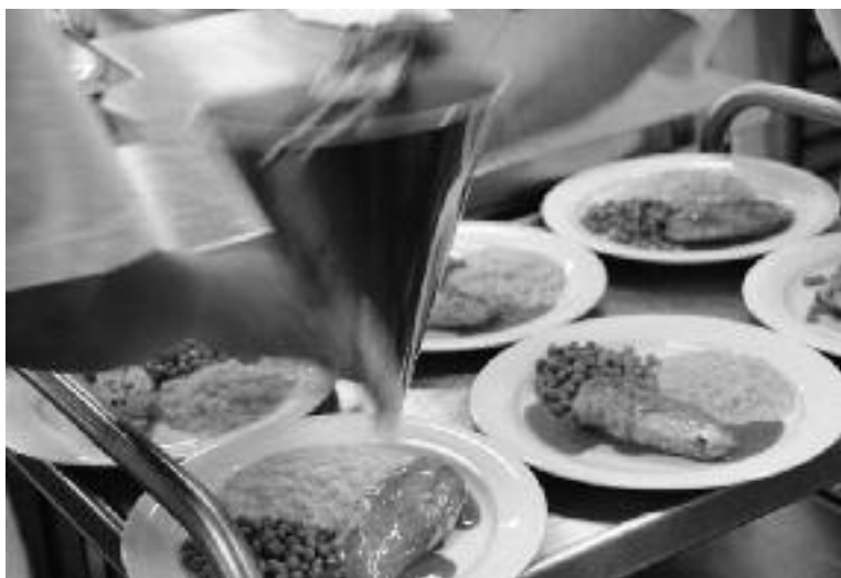
Modernste Infrastruktur im neuen Produktionsgebäude Schübelbach

Mit dem Bezug der beiden Neubauten in Ingenbohl und Schübelbach im Berichtsjahr hat die BSZ Stiftung weitere Meilensteine gesetzt. Die lernende Organisation steht auf einem soliden Fundament. Das Ziel der Kontinuität und Weiterentwicklung der BSZ Stiftung ist somit auch mit dem Führungswechsel gewährleistet.