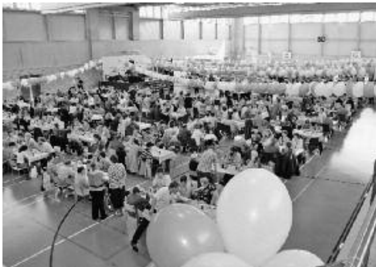
Feststimmung in der Turnhalle Lachen

Lilian Hässig, Fachstelle PR/Kommunikation