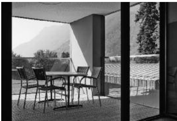
hell und lichtdurchflutet

Das Landwirtschaftsprojekt konnte vollumfänglich aus Spendengeldern finanziert und zügig realisiert werden. Die BSZ Stiftung bedankt sich für dieses Engagement bei ihren Spendern ganz herzlich.