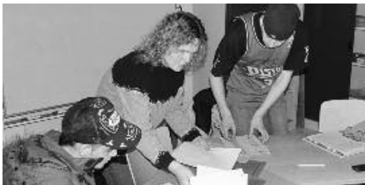
Ausbildung in der BSZ Stiftung

Leider konnten im Sommer 2009 nicht alle offenen Lehrplätze für Menschen mit einer Beeinträchtigung besetzt werden. Die Präsenztage im Vergleich zum Vorjahr sanken daher um 80 Tage. Trotz dieses Rückgangs konnte das Ausbildungszentrum auch im Jahr 2009 kostendeckend betrieben werden. Die Qualität der Ausbildung darf man weiterhin als sehr gut bezeichnen, konnten doch auch dieses Jahr ein guter Notendurchschnitt sowie eine grosse Anzahl an Spitzenplatzierungen erreicht werden.