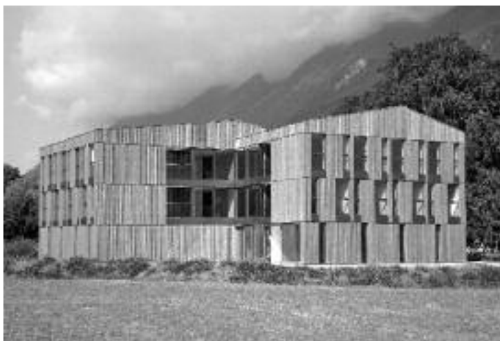
Neubau Wohnen Ingenbohl

Am Nachmittag stand das neue Wohnhaus für die interessierte Bevölkerung offen. Mehr als 600 Interessierte besichtigten die Räumlichkeiten. Wohnen Ingenbohl bietet Platz für die zwei Wohngemeinschaften Fronalp-