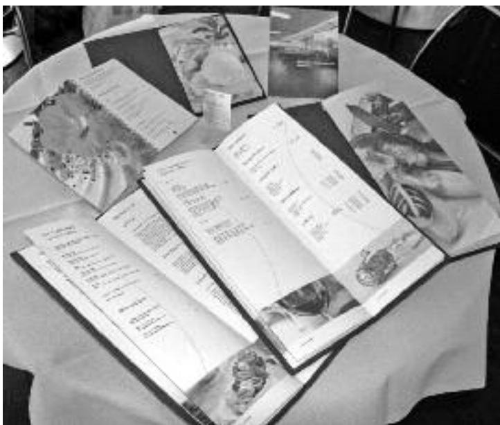
Ansprechende Drucksachen für den PLUSPUNKT

Wir freuen uns über den gelungenen Neuauftritt und hoffen natürlich, damit das Gasthaus PLUSPUNKT einem noch breiteren Publikum bekannt- und schmackhaft machen zu können.