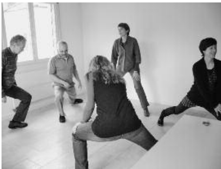
Auch «Bürolisten» bewegen sich

Seit mehreren Monaten treffen wir uns im 3. Stock, Hausmatt 5, zum Turnen. Im Wochenrhythmus turnt jemand anders vor, was eine schöne Abwechslung mit sich bringt. Während die einen hauptsächlich auf Entspannungs- und Fitnessübungen setzen, gestalten die anderen die 10 Minuten auch mit Hilfsmitteln, wie z. B. verschiedenen Bällen. Dadurch erleben wir immer wieder lustige Momente, indem wir beispielsweise dem Ball nachjagen. Anstrengender wird es, wenn wir in der Hocke den Hang hinuntersausen. Mit dem Ende des Winters wird vielleicht das Training nun lockerer?