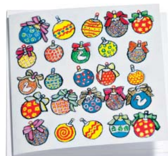
Farbige Kugeln 16.5 x 16.5 cm