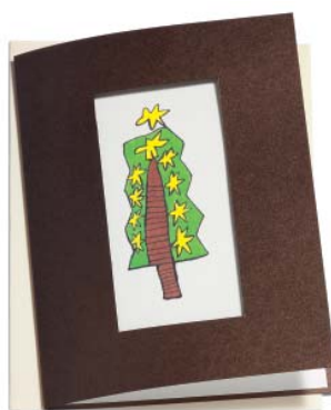
Sternentanne 15.2 x 21.6 cm