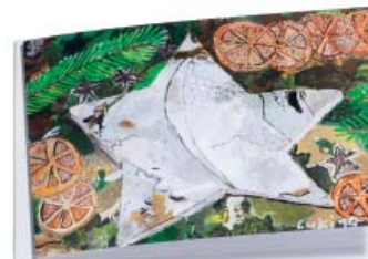
Weihnachtsduft 17 x 12 cm