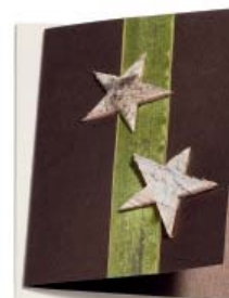
Natursterne 10.5 x 14.8cm