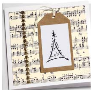
Sinfonie 16 x 16 cm