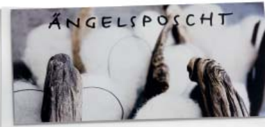
Ängelsposcht 10.5 x 21 cm (einlagig)