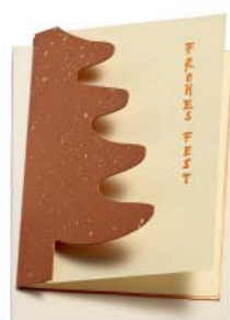
Goldtanne 10.5 x 14.8 cm