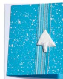
Türkisband 10.5 x 14.8cm