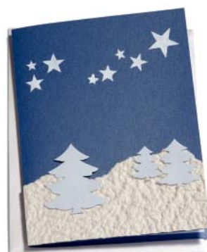
Winternacht 14.8 x 19 cm