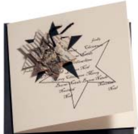
Weihnachtsgruss 13 x 13 cm