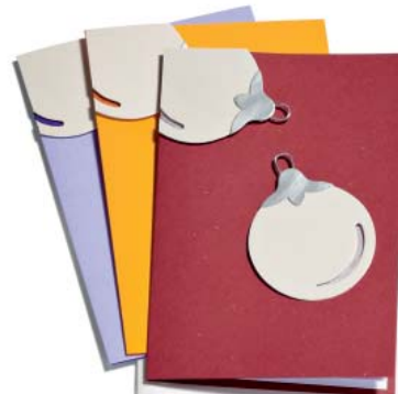
Kugelglanz auf Rot, Gelb oder Lila 12.5 x 18 cm