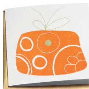
Päckli 15.5 x 15.5 cm