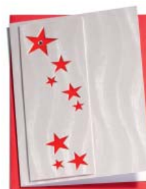
Roter Sternenhimmel 10.5 x 14.8cm