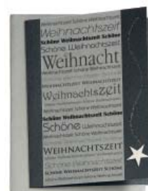
Schöne Weihnachtszeit 10.5 x 14.8cm