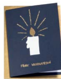
Kerzenglanz 10.5 x 14.8cm