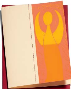
Weihnachtsengel 15.2 x 21.6 cm