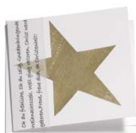
Oh du fröhliche 13 x 13 cm