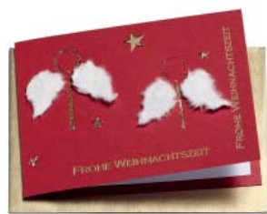
Engelpaar 14.8 x 10.5 cm

Die Karten liefern wir mit neutralem Einlageblatt und passendem Couvert. Weitere Karten finden Sie unter www.bsz-sinnvoll.ch