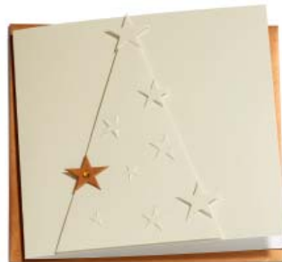
Kupferstern 16 x 16 cm