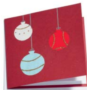
Goldkugel 14 x 14 cm